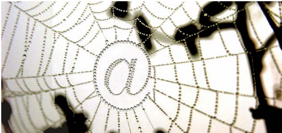
Material 1: Das Netz, in dem wir alle hängen

Ihr Kommentar sollte etwa 800 Wörter umfassen.